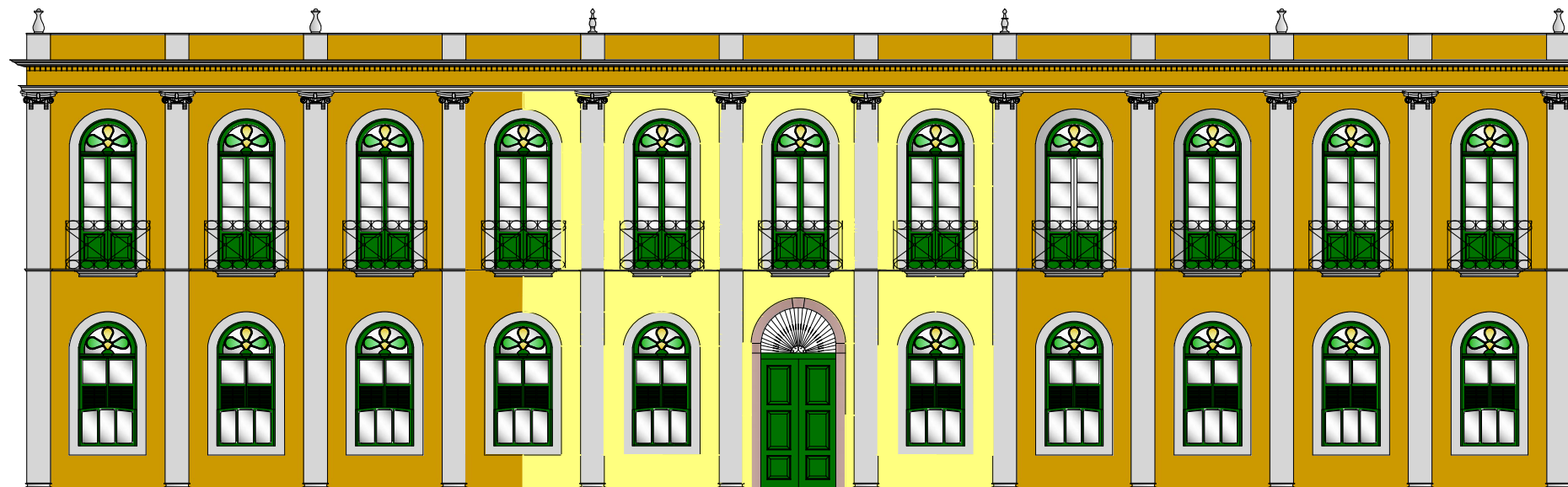
1 FACHADA PRINCIPAL- MAMEDE FROES DE ANDRADE ESCALA 1:150